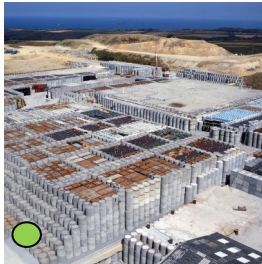
Cherbourg: déconstruction des sous marins nucléaires